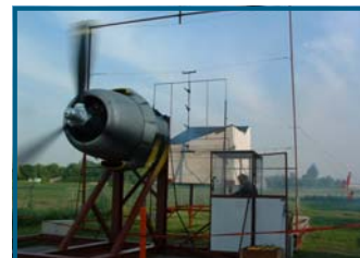
Les essais de résistance au vent sont effectués avec un moteur d'avion qui crée des vents supérieurs à 100 milles à l'heure.

Weather-Tite, Weather-Tite GL, Tite-Lok et Tite-on sont assortis de leur propre mode de pose spécial pour la garantie contre les grands vents. Veuillez consulter notre site internet pour en connaître les détails.